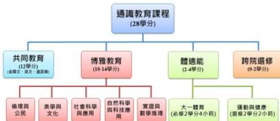
109學年度入學生通識課程架構圖(學士班)