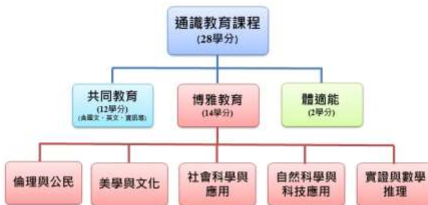
109學年度入學生通識課程架構圖(進修學士班)